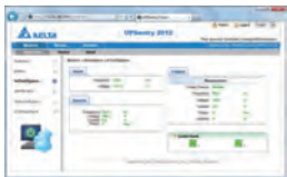
Advanced UPS Management Software - UPSentry 2012