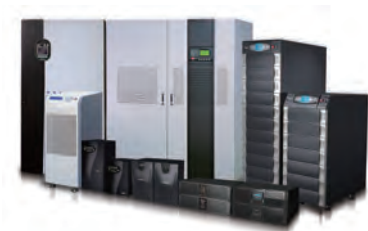
Delta offers full range UPS solutions from 600 VA to 4000 kVA to fulfill your power security needs.